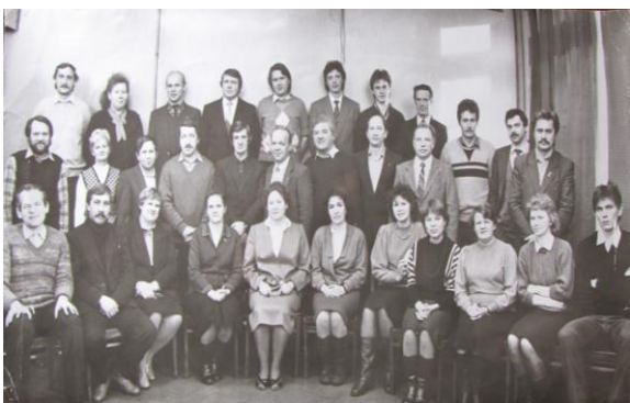
Работники ГСКБ, участвовавшие в разработке тракторов данного семейства (выпускники ЛИФа)