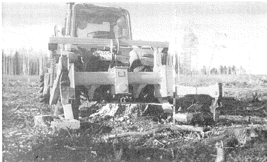
Рис. 1. Лункообразователь Л-2У, агрегатированный с трактором МТЗ-82