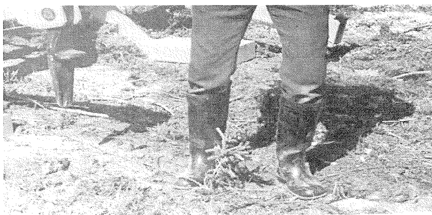
Рис. 2. Заделка растений в лунки, подготовленные Л-2У

Рабочие органы лункообразователей (иглы) изготовлены из марганцовистой стали марки 110Г13Л, применяемой для зубьев ковшей экскаваторов, гусеничных траков и других изделий, работающих в ударном о камни режиме. Общая прочность конструкции Л-2У рассчитана на тяговую силу до 30 кН.