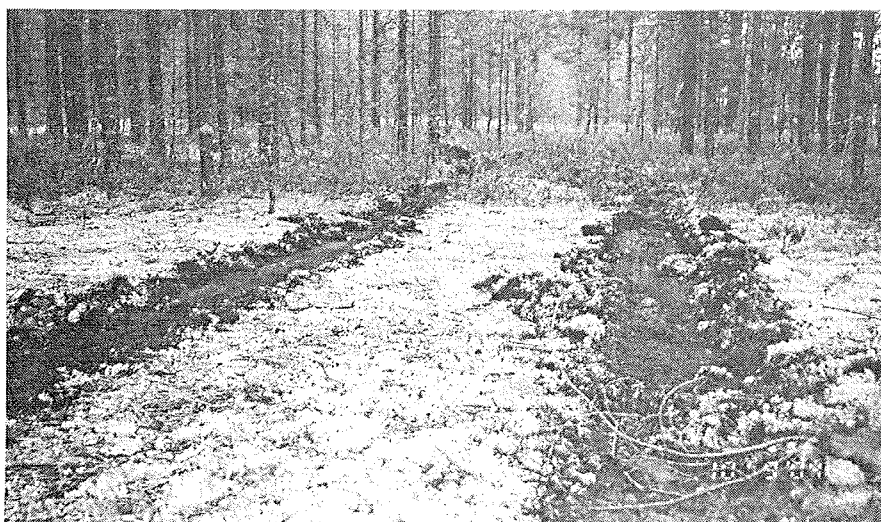
Рис. 4. Борозды, подготовленные лыжами лункообразователя Л-2У