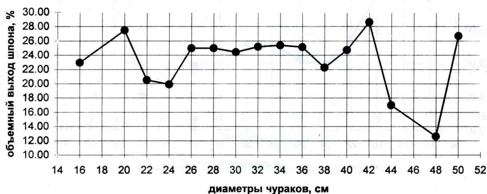
Рис. 2. Суммарный выход шпона

5. Качество древесины березовых чураков, заготовленных на территории Карелии, позволяет вести процесс лущения до минимально возможных значений диаметра карандаша, которые обеспечиваются размерами зажимных кулачков лущильного станка.