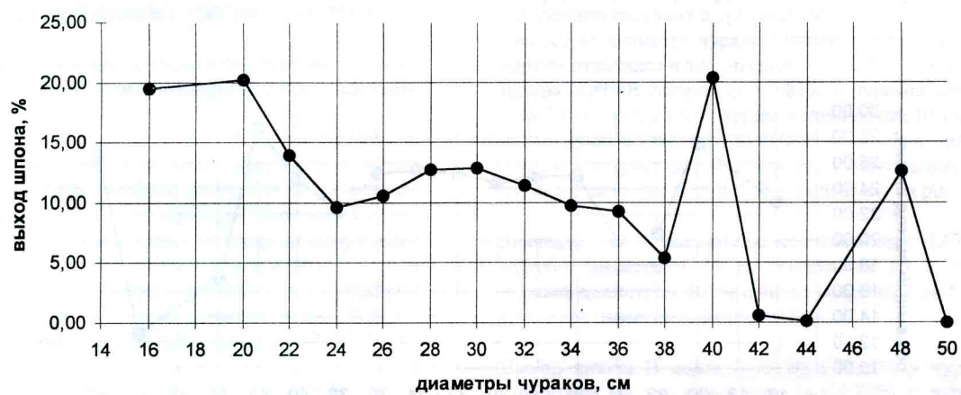
Рис. 5. Выход шпона II сорта