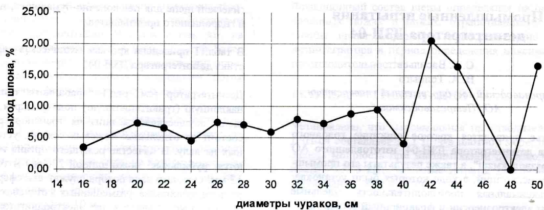
Рис. 6. Выход шпона III сорта