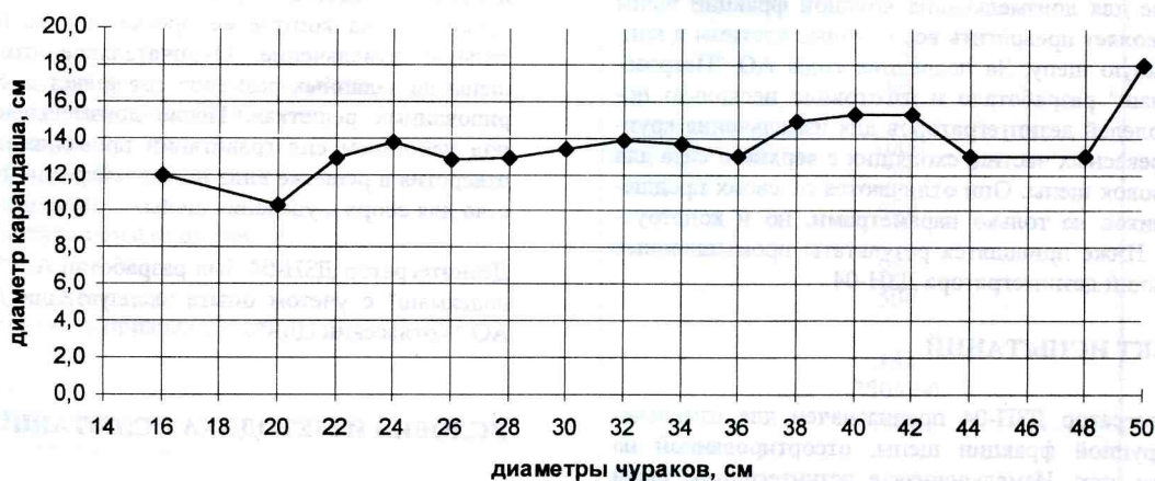
Рис. 8. Диаметры карандашей после лущения чураков