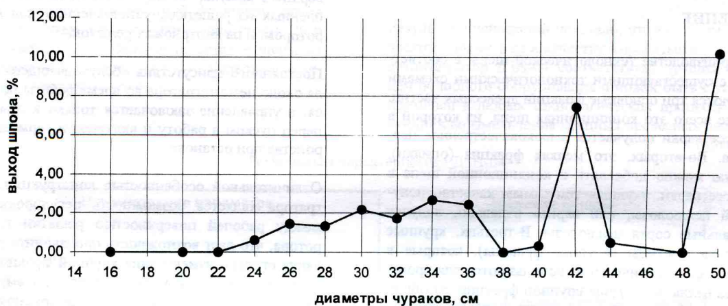
Рис. 7. Выход шпона IV сорта