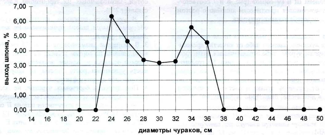
Рис. 4. Выход шпона I сорта