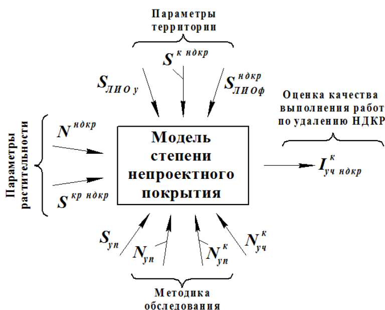
Рисунок 1. Схема формирования математической модели выявления степени непроеKTного покрытия нежелательной растительностью

Входные параметры и выходной показатель разработанной нами математической модели выявления степени непроеKTного покрытия представлены графически на рисунке 1.