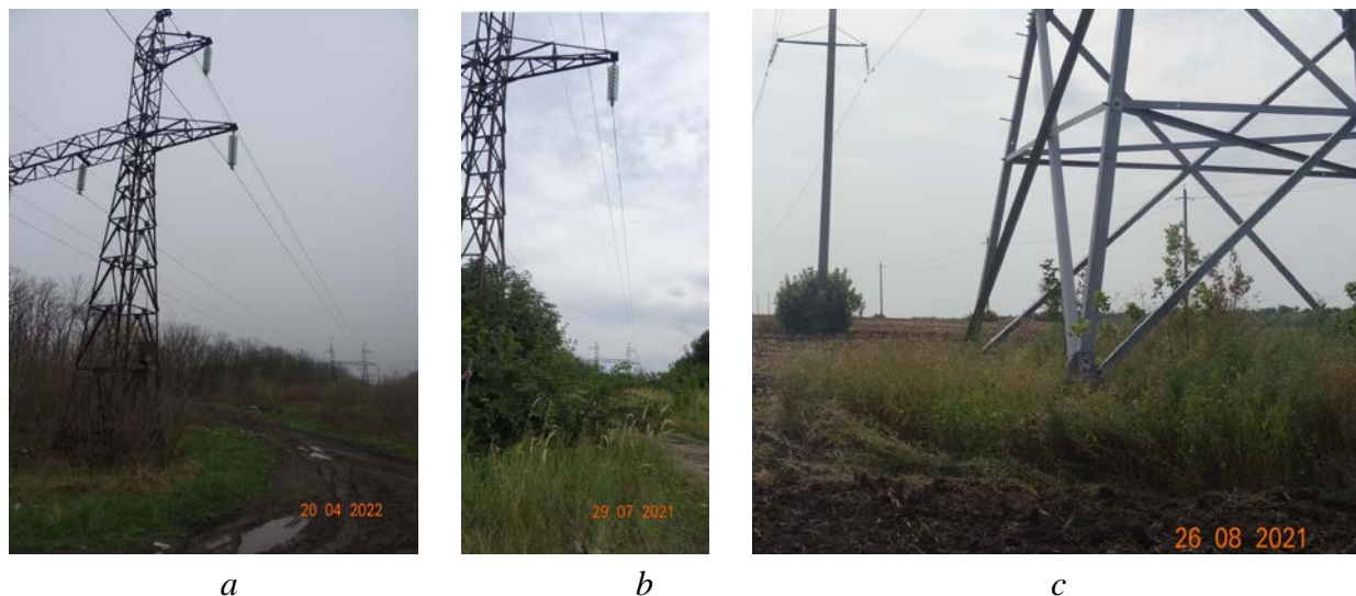
Фото 2. Нежелательная растительность на территориях трасс линий электропередачи: a — ПС КБХА — ПС Южная, апрель 2022 г.; b — ПС КБХА — ПС Южная, июль 2021 г.; c — ПС Красная Яруга — ПС Томаровка, август 2021 г.

(но при этом разросшимся и облиственным) экземпляром нежелательной растительности (фото 2с; дальняя опора ЛЭП).